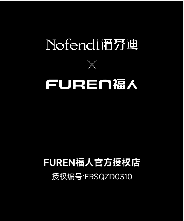
样式一：当合作门店logo为横版时使用

户外产品所有材料要求具有防锈、防腐、抗紫外线的 能力。喷漆、丝网印刷要求抗紫外线。